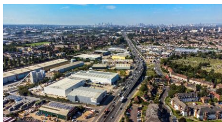
Mileway - Paneuropéen

Votre capital est à risque et vous pouvez perdre tout ou partie de votre investissement. Rien ne garantit que le Fonds atteigne ses objectifs, suive un thème particulier ou ne subisse des pertes substantielles. Les performances passées ne préjugent pas des performances futures. L'utilisation de l'effet de levier ou des emprunts amplifie les risques d'investissement, de marché et certains autres risques et peut avoir un impact significatif sur les performances, entraînant la perte partielle ou totale du capital investi. Les dividendes sont à la discrétion de l'AIFM et ne sont pas garanties.