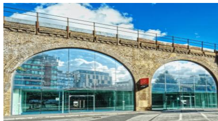
ArchCo - Royaume-Uni