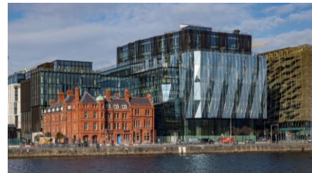
Actif de bureau Adare - Dublin, Irlande

Remarque : lorsqu'elles sont utilisées dans le présent document et sauf indication contraire ou si le contexte l'exige, les références au « Fonds » doivent être lues comme des références à Blackstone European Property Income Fund S.L.P. (« Blackstone Bepimmo ») et à ses entités parallèles, telles que Blackstone European Property Income Fund SICAV et Blackstone European Property Income Fund (Master) FCP. Tous les indicateurs de portefeuille présentés dans ce document se rapportent au Fonds, à l'exception des performances, des frais et des informations sur les catégories de parts, qui se rapportent à Blackstone Bepimmo. Les conditions d'éligibilité des investisseurs et les montants minimums de souscription s'appliquent. Les termes en majuscules utilisés mais non définis ont la signification qui leur est donnée dans les Statuts. Veuillez vous référer aux Statuts pour de plus amples informations. 1-3. Veuillez consulter la page 5 pour les notes explicatives.